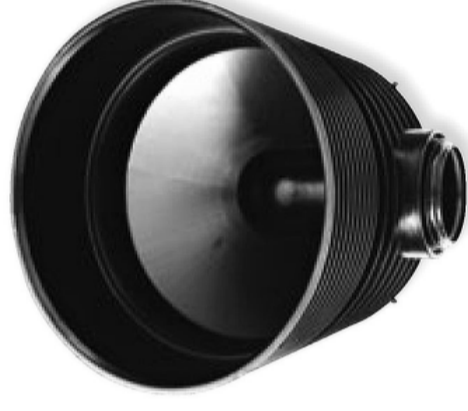
ŠACHTOVÉ DNO (NAPR. TEGRA 600) Z PP VRÁTANE TESNENIA KONCOVÉ ILUSTR. OBRÁZOK